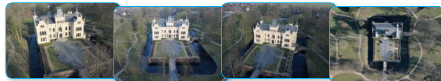
Mit Hilfe von vorher exakt definierten Zielpositionen steuert der MikroKopter automatisch bestimmte Wegpunkte an, richtet sich auf den Point of Interest aus, verweilt für einen voreingestellten Zeitraum und ermöglicht so weitgehend planbare Fotos

Im Flug hält der MikroKopter seine „Nase“ und damit die Kamera in Richtung des POI. Dazu wird die aktuelle GPS-Position ständig mit der Position des ausgewählten Ziels verglichen und der entsprechende Winkel berechnet. Mittels elektronischem Kompass in der Navigationseinheit richtet sich der Kopter dann zuverlässig aus.