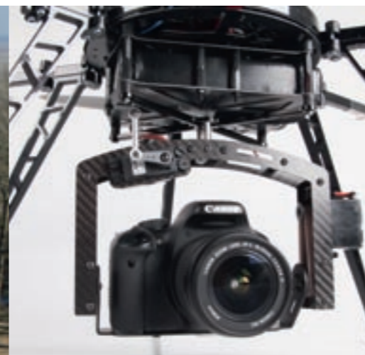
Die Kamerahalterung wird von handelsüblichen Servos automatisch in die gewünschte Richtung gesteuert

Zur Veranschaulichung ein typisches Beispiel: Aufgabe sind Foto- und Filmaufnahmen von einem Gebäude aus unterschiedlichen Blickrichtungen. Normalerweise bräuchte man neben der Kamera auch noch eine Videofunkverbindung mit Monitor und eventuell eine zweite Person, um MikroKopter sowie Kamera so auszurichten, dass man die gewünschten Ansichten erhält. Mit der POI-Funktion